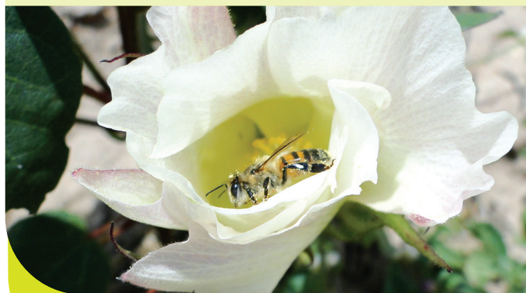
Abelha de mel ( Apis mellifera ), visitante floral muito frequente nos algodoeiros.