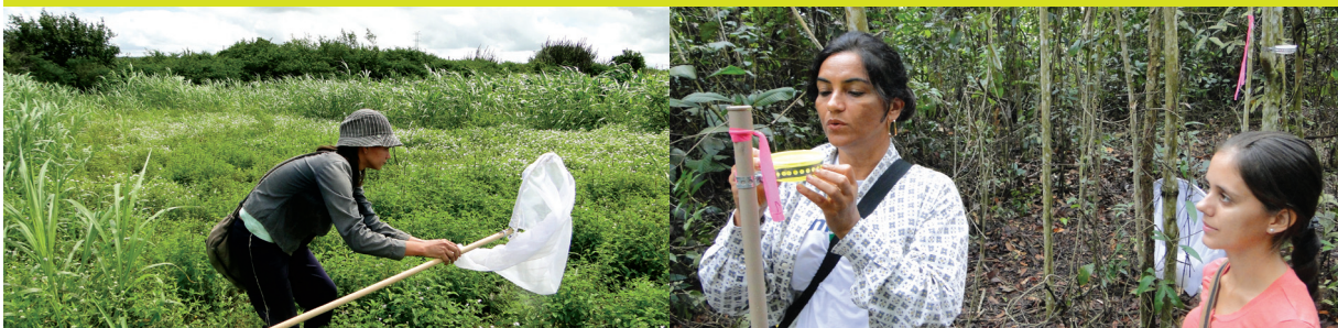
Coleta de abelhas com puçá em Remígio - PB (foto à esquerda) e pratos coloridos instalados em vegetação natural de floresta em Sinop - MT (foto à direita).