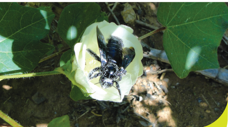
Abelha mamangava ( Xylocopa sp. ), uma das espécies polinizadoras do algodoeiro.