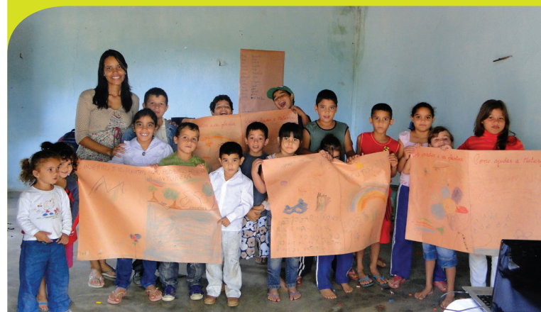
Cartazes produzidos pelas crianças da escola do Assentamento Zé Marcolino durante a atividade recreativa.

um recebeu uma cartolina para que os alunos desenhassem o que tinham aprendido durante a aula. Os desenhos feitos pelos alunos foram muito criativos, e traduziram a importância da biodiversidade local, mostrando as funções das plantas e dos animais na natureza. Esta atividade foi importante porque os alunos puderam trocar informações com os colegas, cada um ajudando o outro a aumentar o seu conhecimento sobre o assunto.