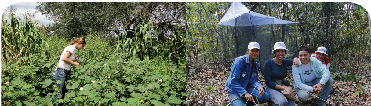
Coleta de abelhas nos algodoeiros em Prata - PB (foto à esquerda) e armadilha Malaise instalada em vegetação natural de cerrado em Mundo Novo - GO (foto à direita).

Ainda não sabemos se estamos perdendo polinizadores nas áreas que estudamos, mas com esses estudos, passamos a conhecer muitas espécies de abelhas que ainda não tinham sido registradas para esses locais. Agora que conhecemos as espécies vai ficar mais fácil conservá-las.